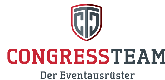
CongressTeam Dresden GmbH